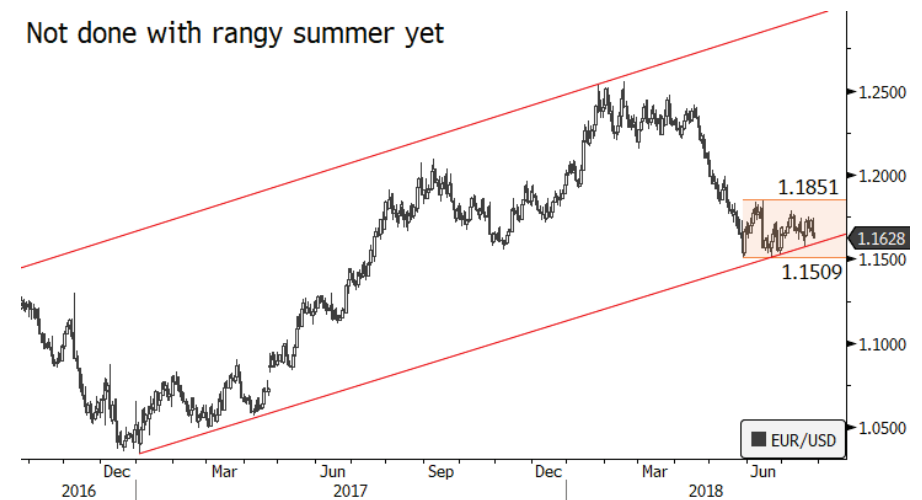
Not done with rangy summer yet

La cautela de Draghi impulsó en el mercado del dólar un rally generalizado. Durante la conferencia de prensa, el EUR/USD cedió más de un 0.70%, para cotizar a los 1.1640 dólares por euro. Por más de que los datos macro de EE.UU hayan sido decepcionantes (las órdenes de bienes duraderos de junio aumentaron en un 1% intermensual versus el 3% esperado y +0.4% intermensual vs +0.5% excluyendo transporte), no evitó que el Índice del Dólar se alzase más de un 0.60%, hasta el 94.76. Más adelante en la sesión de este viernes, se espera que la publicación del PIB del segundo trimestre de EE.UU, arroje un resultado “sensacional”. Pero de darse un resultado no tan contundente, el billete verde podría quedar expuesto a una corrección tras su valoración más reciente. A largo plazo, las discusiones comerciales continuarán siendo el principal impulsor en el mercado FX. Ante las incertidumbres que hay actualmente en torno a la guerra comercial entre EE.UU y China, los inversores no pueden dar aún por culminado el trading de rango de este verano.